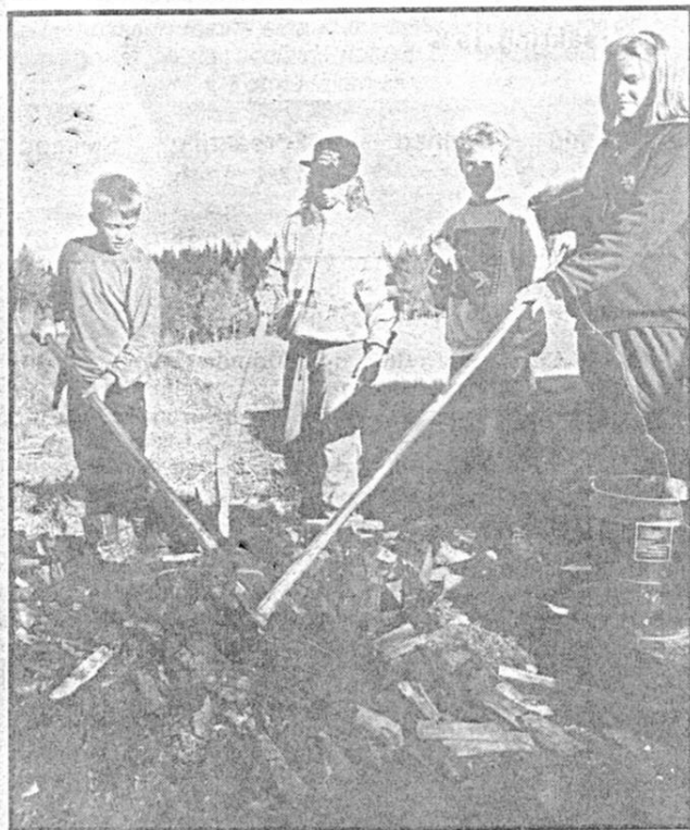
Stugueleverna har just rivit sin minikolmila.